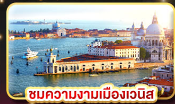
ชมความงามเมืองเวนิส