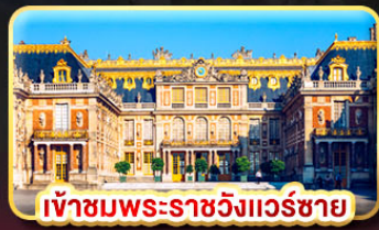
เข้าชมพระราชวังแวร์ซาย