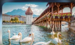
สะพานไม้ซาเปล