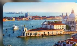
ชมความงามเมืองเวนิส