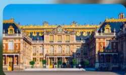
เข้าชมพระราชวังแวร์ซาย