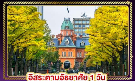
อิสระตามอัธยาศัย 1 วัน

น้ำหนักกระเป๋า 20 Kg. บริกอาหาร บนเครื่อง ไป-กลับ