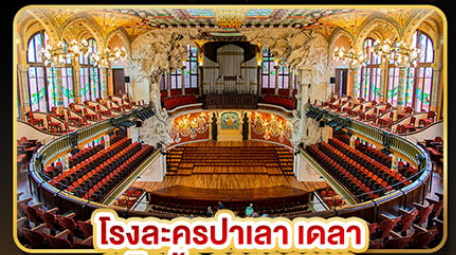
โรงละครปาเลา เดลา มูสิกา คาทาลานา