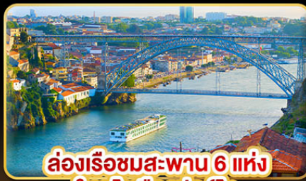
ล่องเรือชมสะพาน 6 แห่ง ในคูโรเมืองปอร์โต