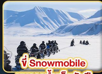
ขี่ Snowmobile บนธารน้ำแข็งพันปี