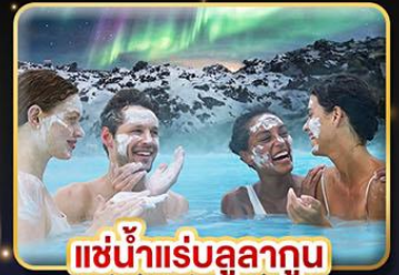
แช่น้ำแร่สุขภาพ