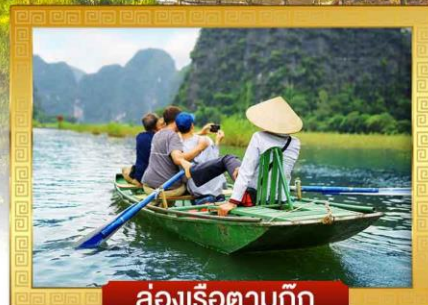
ล่องเรือตามก๊ิก