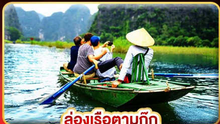
ล่องเรือตามก๊ิก