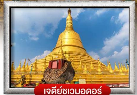
เจดีย์ชเวมอดอร์

เมนู สุดพิเศษ | กุ้งแม่น้ำเผา + บุฟเฟ่ต์นานาชาติ