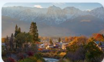
โออิเดะ ปาร์ค