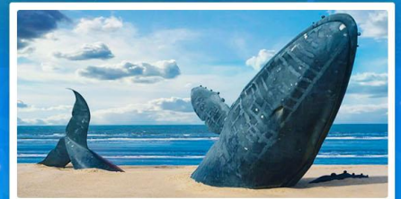
ชายหาดวาฬโดดเคี้ยว