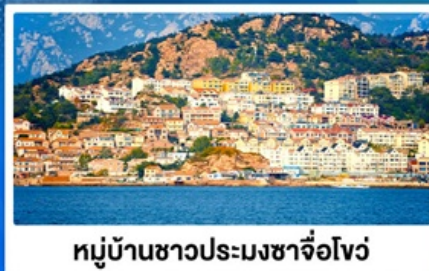
หมู่บ้านชาวประมงซาจื่อโจว