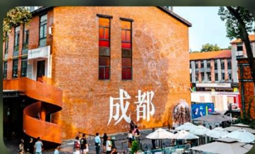
ดงเจียวจี้