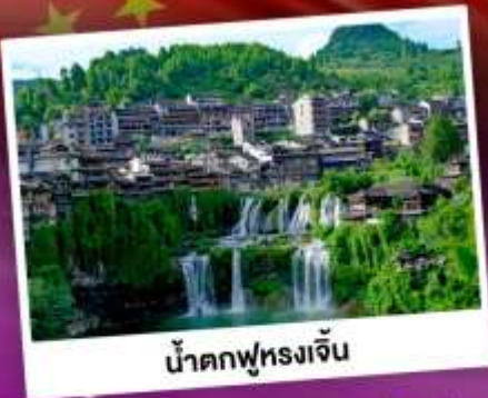
น้ำตกฟูหลงเจิ่น

เที่ยวชมหมู่บ้านโบราณริมน้ำตก "ฟูหลงเจิ่น" นั่งกระเช้าขึ้นสู่อุทยาน กูเขาเจ็ดดาว