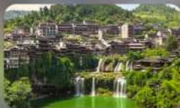
หมู่บ้านโบราณฟุทงเจิน