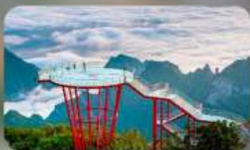
ภูเขา 7 ดาว