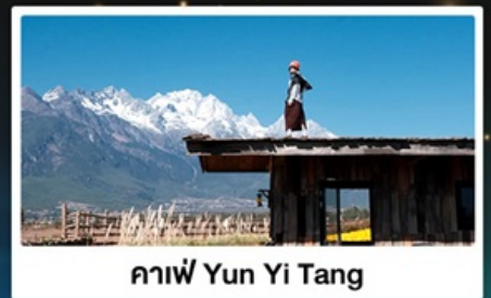
กาแฟ Yun Yi Tang