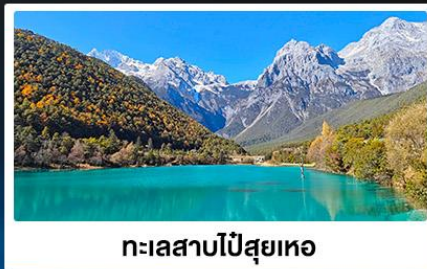
ทะเลสาบโป๋สยเหอ