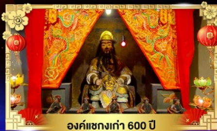
องค์แซงเก่า 600 ปี