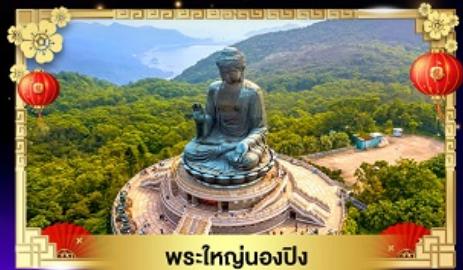
พระไถญนองปิง