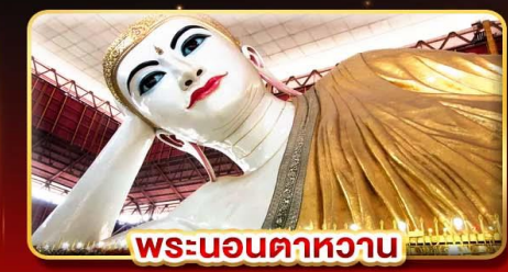
พระบอนตาหวาน