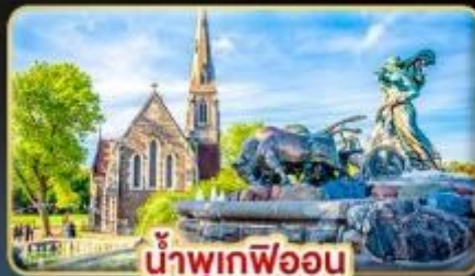
น้ำพุเทพอน