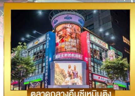
ตลาดกลางคินซีเหมินติง