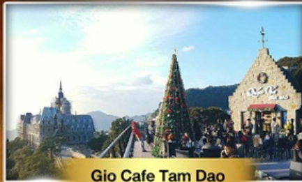
Gio Cafe Tam Dao