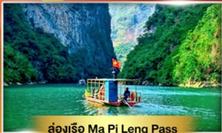
ล่องเรือ Ma Pi Leng Pass

เส้นทางเปิดใหม่ ฮาหยาง เช็กอินเมืองตามด้าว "เวียดนามฟีลยุโรป"