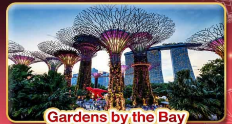
Gardens by the Bay