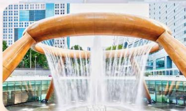
Fountain of Wealth