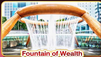
Fountain of Wealth