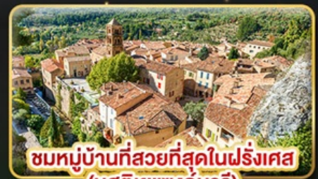
หมู่บ้านที่สวยงามที่สุดในฝรั่งเศส (มูสติเยแซงก์มารี)