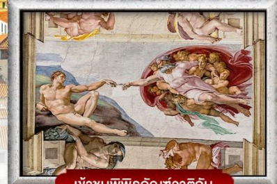
เข้าชมพิพิธภัณฑ์วาติกัน