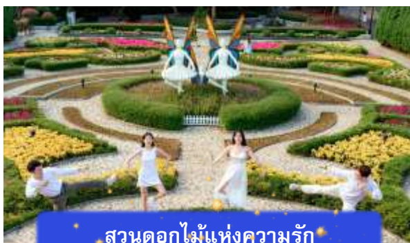
สวนดอกไม้แห่งความรัก

อิสระท่านท่องเที่ยว สวนสนุกแพนตาซีพาร์ค ซึ่งมีเครื่องเล่นหลากหลายรูปแบบ เช่น ทำทนายความมันส์ของหนัง 4D ระทึกขวัญกับบ้านผีสิง เกมส์สนุกๆ เครื่องเล่นเบาๆ รถบั้ง หรือจะเลือกซื้อป๊ิงของที่ระลึกของสวนสนุก และ จัตุรัสแห่งดวงดาว เปรียบเสมือนการเดินทางสู่อาณาจักรแห่งดวงดาวที่มีเส้นทางเชื่อมต่อระหว่างอาณาจักรแห่งดวงจันทร์และอาณาจักรแห่งดวงอาทิตย์ถนนที่แสนงดงาม และสถาปัตยกรรมที่ล้ำสมัยจุดเด่นของที่แห่งนี้ก็คือกระจกใสทรงสามเหลี่ยมที่ดูคล้ายกับพิพิธภัณฑลู่ฟวร์ที่ฝรั่งเศส ให้ความรู้สึกลเหมือนท่านกำลังท่องอยู่ในโลกแห่งเวทมนต์และดวงดาว (ไม่รวมค่าเข้าชมหุ่นขี้ผึ้งราคาประมาณ 1 แสندอง)