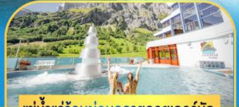
แช่น้ำแร่ร้อนผ่อนคลายลวยคอร์บิค