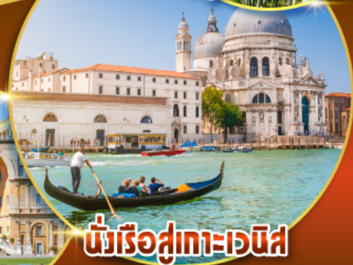
นั่งเรือสู่เกาะเวนิส