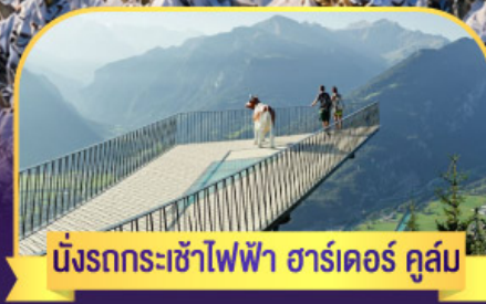
นั่งรถกระเช้าไฟฟ้า ชาร์เตอร์ คูส์ม