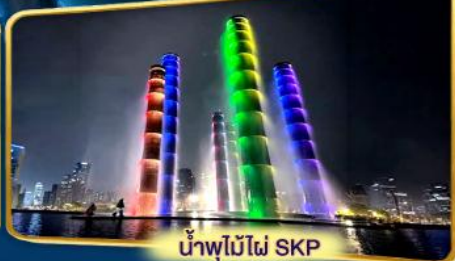
น้ำพุไม้ไผ่ SKP