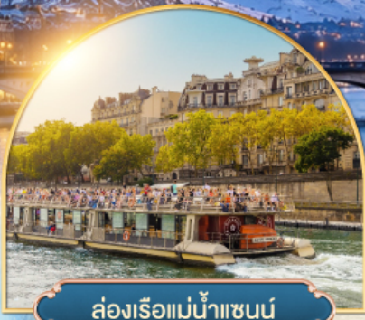
ล่องเรือแม่น้ำแซนน์