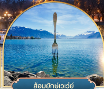
ล้อมยักซ์เวอว์