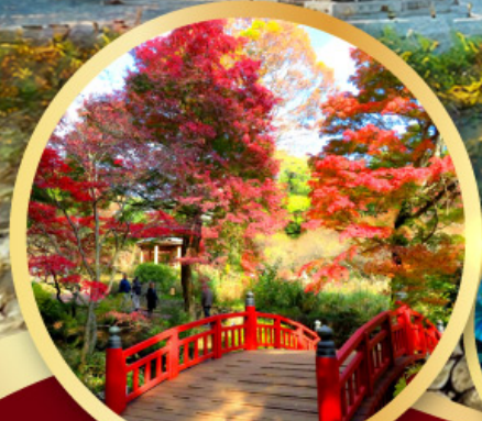
สวนดอกบ๊วยอาตานิ