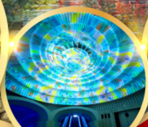
พิพิธภัณฑ์ศิลปะ MOA