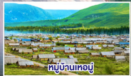
หมู่บ้านเหมอู๋