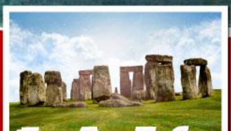
เยือนสโตนเฮนจ์ และ พิพิธภัณฑน์โรมันบาร