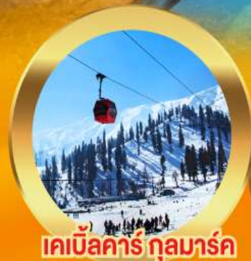
เคเบิลคาร์ กุลมาร์ค