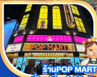
ร้านPOP MART ที่ใหญ่ที่สุดในไต้หวัน