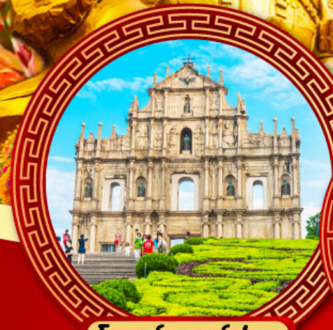
โบสถ์เซนต์ปอล