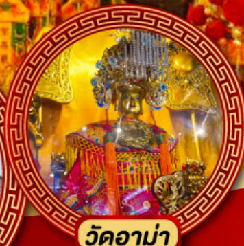
วัดอาม่า