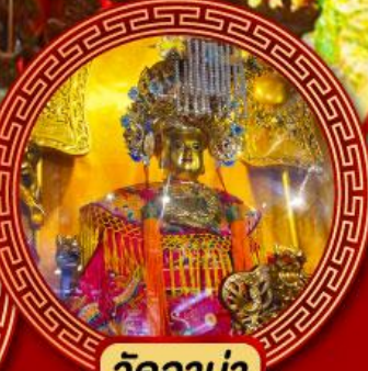
วัดอาม่า