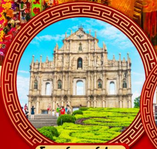
โบสถ์เซนต์ปอล