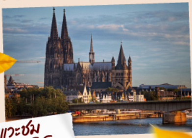
แควซ่ม มเซาเวินโคโลญ