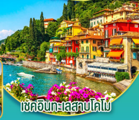
เชคอินทะเลสาบโคโล