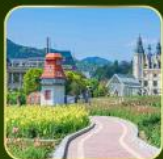
สวน Alice's Garden