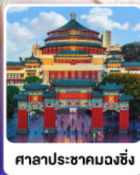
ສາລາປະຮາກມວງຈິງ