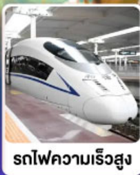
ຣົດໂຟຼກວາມເຣີວສູງ