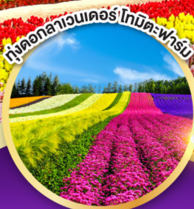
ทุ่งดอกลาเวนเดอร์โทมิตะฟาร์ม