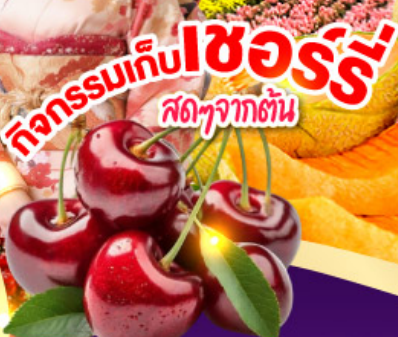
กิจกรรมเก็บเชอร์รี่ สดๆจากต้น