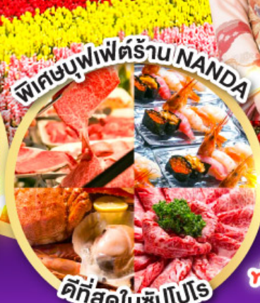
พิศขุมพีเฟ็ดร้าน NANDA