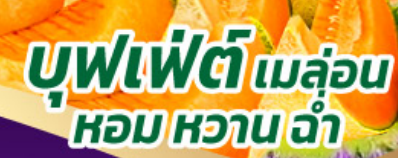
บุฟเฟ่ต์เมล่อน หอมหวานฉ่ำ