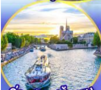
ล่องเรือแม่น้ำเซน