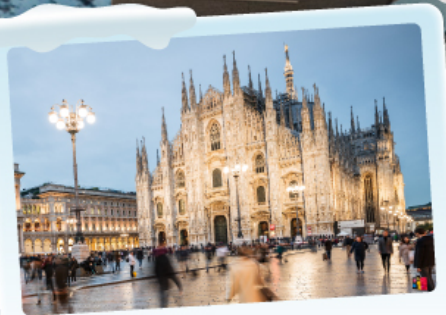
คูโอโม มิลาน