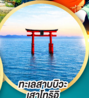
ทะเลสาบบิวะ เสาโทริอิ

เส้นทางสายอัลไพน์ทากายามา กำแพงหิมะ เพื่อนคู่โรเบะ