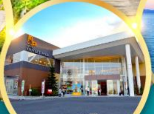
มีตชยูเอทาลีทพาร์ค คาโดมะ