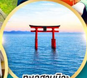
ทะเลสาบบิวะ เสาโทริอิ

เส้นทางสายอัลไพน์ทาเคยาม่า กำแพงหิมะ เขื่อนคุโรเบะ