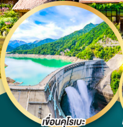
เพื่อนคู่โรเบะ