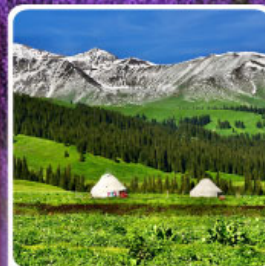
ทุ่งหญ้านาลาติ