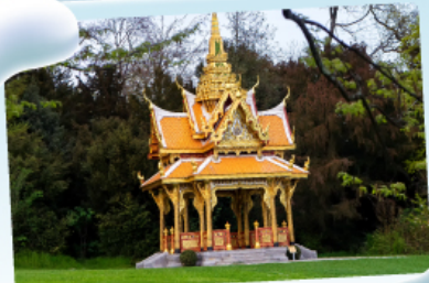
ศาลาไทย ไสซานน์