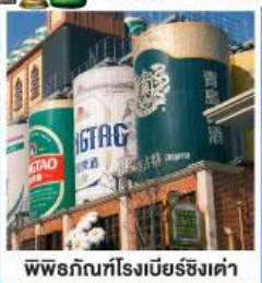
พิพิธภัณฑ์โรงเบียร์ซิงเต่า