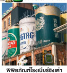
พิพิธภัณฑ์โรงเบียร์ชิงเต่า