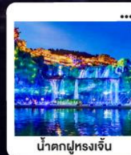
น้ำตกฝูหลงจิ้น

"มหัศจรรย์...จางเจียเจีย" | ดินแดนแห่งขุนเขาและสายน้ำ "เขาเกียนเหมินซาน" | ประตูล่องเรือ...ท่าอากาศยาน 999 ชั้น | นั่งรถไฟความเร็วสูง สัมผัสความสวยงามระบียงแก้ว "อุทยานอวตาร" | ส่องล่องกลางขุนเขา...ดั่งภาพฝันในห้วงนภชา | ช้อปปิ้ง POPMART "เมืองโบราณ" ฝูหลง | หยูดเวลา ณ เมืองบนม่านน้ำตก... | "เฟิ่งหวง" ล่องเรือชมชีวิตริมแม่น้ำทิวเจียง "นครฉางซา" ปิดท้ายความทันสมัย