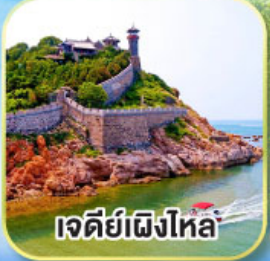
เจดีย์เฝิงโหล