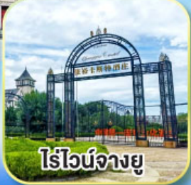
ไร่ไวน์จางยู