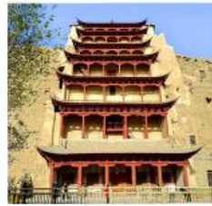
ถ้ำม่อเกา