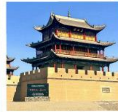
ถ้ำแพงเจียยี่กวน