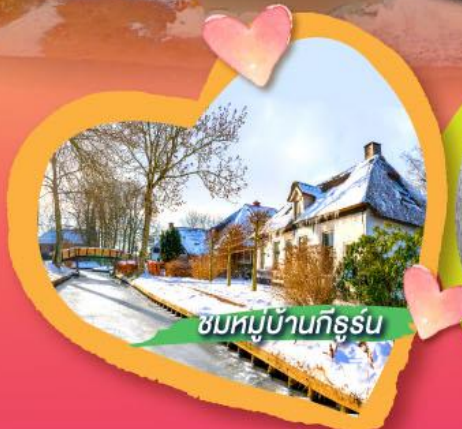
ชมหมู่บ้านกิธูรม