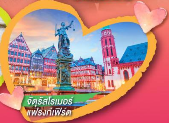
จัตุรัสโรเมอร์ แฟรงก์เฟิร์ต