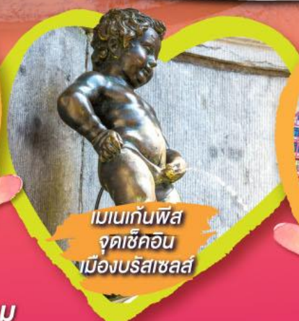
เมเนกันพีส จุดเซ็คอิน เมืองบรัสเซลส์