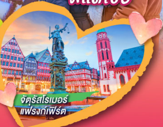
จัตุรัสโรเมอร์ แฟรงก์เฟิร์ต