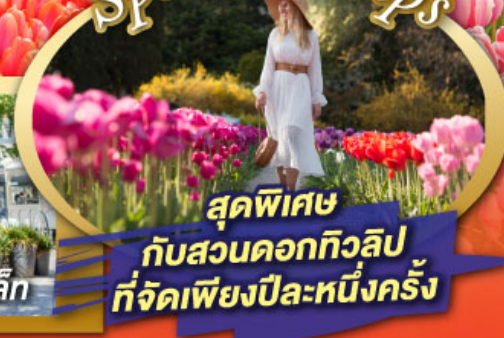
สุดพิเศษ กับสวนดอกทิวลิป ที่จัดเพียงปีละหนึ่งครั้ง