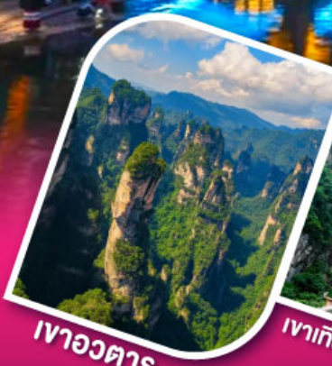
เจาอวตาร