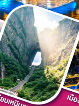
เจาเทียนเหมินทันฟ้าใส