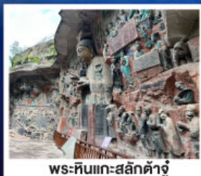
พระหินแกะสลักตัวจู้