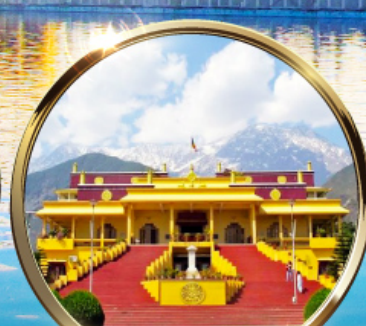
ดาริมซาล่า "ธรรมศาลา" ตำหนักองค์ดาโลลามะ