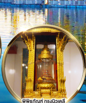
พิพิธภัณฑ์ กรุงนิวเดลี กราบนมัสการพระบรมสารีริกธาตุ